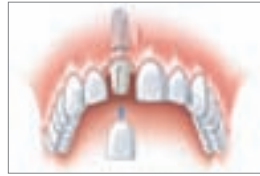
Das eingesetzte Implantat mit der neuen Zahnkrone

Implantate lösen das Problem natürlich und „unsichtbar“. Zahnimplantate sind kleine, hoch entwickelte und ausgesprochen leistungsfähige Titanschrauben, die anstelle natürlicher Zahnwurzeln in den Kiefer gesetzt werden und fest in den Knochen einwachsen. Eine provisorische Versorgung kaschiert die Lücke, bis das Implantat eingehilt ist.