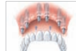
Im Oberkiefer: Brücke auf sechs Implantaten

Auf mindestens sechs Implantaten kann auch eine Brücke dauerhaft an Ihrem Kiefer verankert werden. Der Zahnersatz sitzt dann so fest, dass auf den stützenden rosa Prothesenkunststoff verzichtet werden kann. Im Oberkiefer bleibt in jedem Falle der Gaumen frei von Prothesenmaterial. So genießen Sie in jeder Situation völlige Sicherheit, denn nichts kann sich unverhofft lösen. Mit Ihren implantatgetragenen Dritten können Sie essen, reden und lachen, als ob es Ihre Zweiten wären.