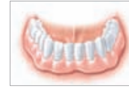
Die Prothese sitzt fest

Beim Einsetzen verbinden sich die beiden Elemente, ähnlich wie bei einem Druckknopf: Ihre Prothese sitzt fest. Zum Reinigen können Sie sie jederzeit leicht wieder abnehmen.