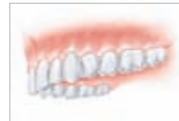
Natürliche Ästhetik, natürliche Funktion

Ein Provisorium schließt die Lücken während der Heilungsphase. Ist diese abgeschlossen, werden auf den Implantaten dauerhaft die endgültigen Zahnkronen oder die Brücke befestigt.