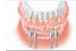
Unterkieferprothese auf vier Implantaten

Wenn Ihnen im Unterkiefer fast alle oder sogar alle Zähne fehlen, haben Sie mit Implantaten trotzdem gut lachen. Denn schon zwei bis vier Implantate reichen aus, um einer Vollprothese festen Halt zu geben. Die Befestigung erfolgt mit speziellen Haltesystemen, die aus zwei Elementen bestehen. Eines wird dauerhaft auf die Implantate gesetzt, das Gegenstück in die Prothese eingearbeitet.