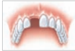
Ein verlorener Zahn z. B. durch einen Sportunfall

Der Verlust eines einzelnen Zahns kann jeden treffen. Oft sogar innerhalb von Sekunden: Sport gemacht, Zahn weg. Das ist zwar erschreckend, aber heute kein Drama mehr.