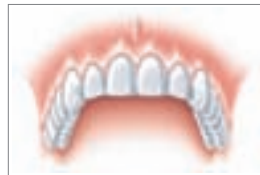
Eine natürlich geschlossene Zahnreihe

Anschließend wird darauf „unsichtbar“ und dauerhaft stabil Ihre neue Zahnkrone befestigt. Sie sitzt mit ihrer neuen Wurzel fest im Kiefer und ist von den natürlichen Nachbarzähnen nicht zu unterscheiden.